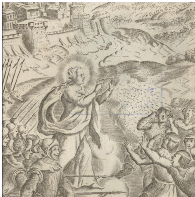
Fig. 10 Detalle del grabado Enfrentamiento entre españoles e indígenas hacia 1640 (Fig. 6). En el extremo izquierdo se representan los españoles y en el derecho los indígenas mapuche; en el centro y defendiendo a los españoles se encuentra Santa María de las

Siguiendo el modelo iconográfico difundido a finales del siglo XVI en la Nueva España, la presencia de la Virgen protagoniza tres grabados de Histórica Relación (Cacheda, 2013). En este caso abordaremos uno de ellos, presente en el libro De la conquista, y fundación del Reyno de Chile .