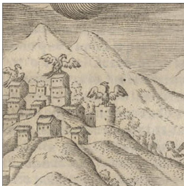
Fig. 12 Detalle del grabado de Hechos milagrosos que procedieron a las paces de Baidés en 1641. Sobre las aldeas indígenas se observan águilas míticas imperiales.

En esta imagen (Fig. 11), se muestra una erupción volcánica ocurrida en 1640, en las tierras del cacique mapuche Aliante (Prieto, 2010). Según Prieto (2010), esta descripción en torno al desastre natural y la reacción de españoles y nativos, sólo intentaba capturar la atención del lector, pues inmediatamente Ovalle anuncia su relación alegórica con las paces de Baidés 3 en 1641. En ese sentido, el grabado representa principalmente los portentos que precedieron a este hecho histórico, aquellos que determinaron la relación entre españoles e indígenas. Citando al autor: “Lo maravilloso, el portento y los monstruos eran todos ejemplos de singularidades capaces de producir asombro, donde las leyes de la naturaleza se suspendían momentáneamente para revelar sentidos diversos a los habituales, abriéndose a lecturas e interpretaciones alegóricas o simbólicas” (Prieto, 2010: 19).