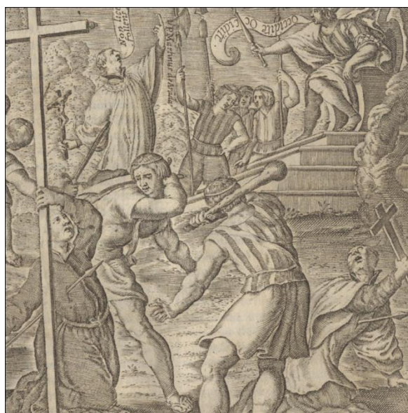
Fig. 9 Detalle grabado (Fig. 8). Indígenas mapuche representados como sujetos violentos, martirizando de manera desmedida a misioneros jesuitas que sostienen la cruz en sus manos. Fuente imagen: Histórica Relación del Reyno de Chile , 1646.