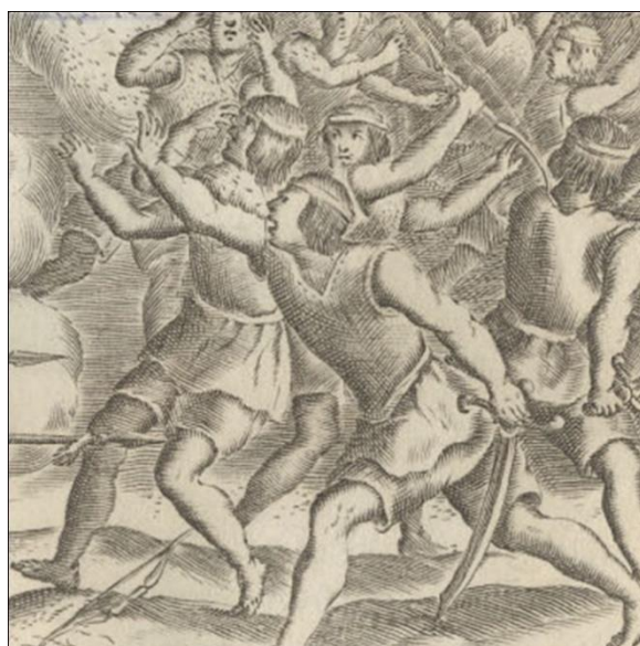
Fig. 7 Detalle grabado (Fig. 6). Indígenas mapuche representados como sujetos corporalmente fuertes y en una actitud de venganza.