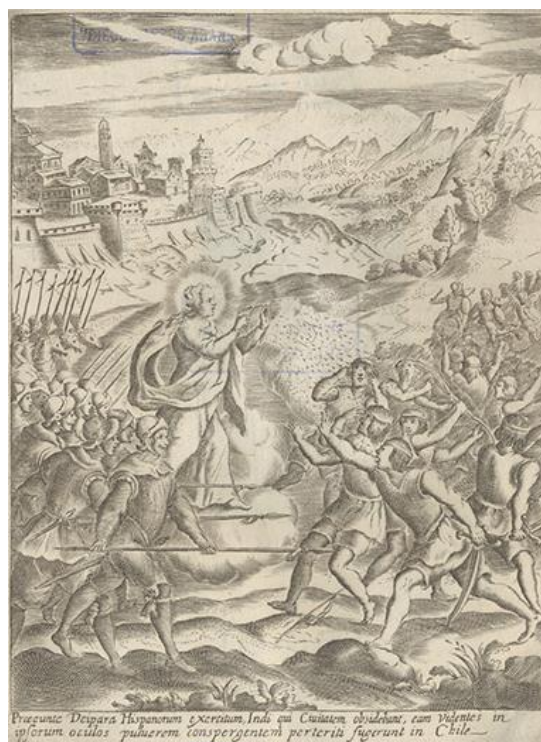
Fig. 6 Grabado. Enfrentamiento entre españoles e indígenas hacia 1640. Fuente imagen: Histórica Relación del Reyno de Chile, 1646.