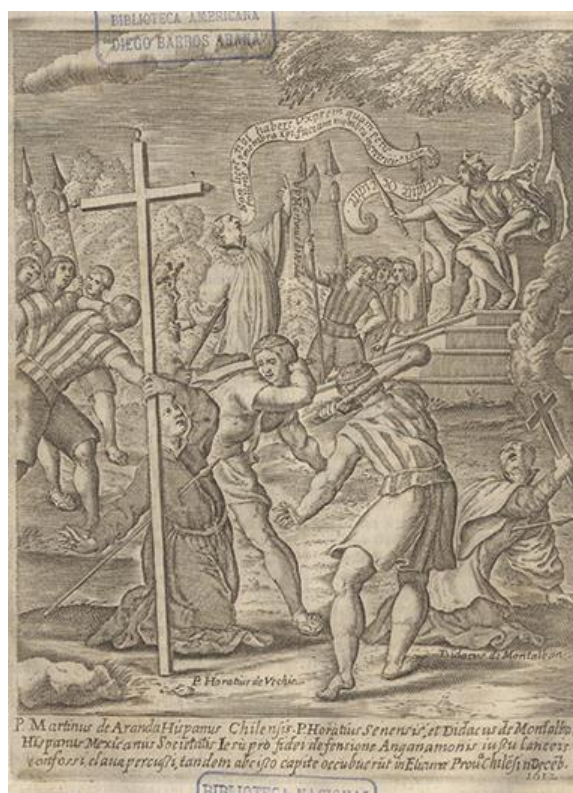
Fig. 8 Grabado. Misioneros jesuitas martirizados por indígenas mapuche. Fuente imagen: Histórica Relación del Reyno de Chile , 1646.