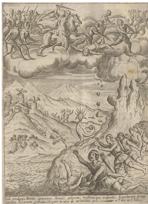
Fig. 11 Grabado. Hechos milagrosos que procedieron a las paces de Baides en 1641. Fuente imagen: Histórica Relación del Reyno de Chile , 1646.

Por otra parte, un grabado de Alonso de Ovalle en el cual están representados los españoles, los mapuche, así como el poder de la naturaleza, está claramente representado en el libro séptimo de la Histórica Relación . En éste, además, se pueden evidenciar aquellos sucesos maravillosos que acontecen en el Nuevo Mundo, y que permiten a los misioneros realizar lecturas simbólicas.