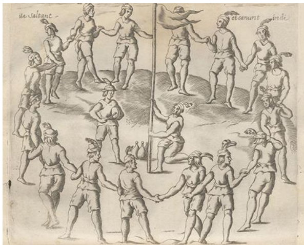
Fig. 3 Grabado. Indígenas en Nguillatún, ceremonia rogativa mapuche. Fuente imagen: Histórica Relación del Reyno de Chile , 1646.