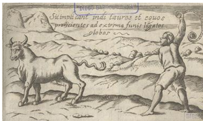
Fig. 5 Grabado. Forma del indígena de lacear un toro.

“Pero aun quando Ovalle podía describir a los mapuches como nobles, estos seguían siendo a sus ojos unos bárbaros, que ‘en sus venganças son notablemente crueles, despedaçando inhumanamente al enemigo quando le han a las manos, leuantandole en las picas, arrancandole el coraçon, haziendole pedaços, y relamiendose como fieras en su sangre’. Esta ambigüedad en la imagen de los indígenas chilenos, presentados simultáneamente por Ovalle como nobles guerreros y como envilecidos salvajes, se explica por el doble origen que Ovalle le atribuía a las características morales de los mapuches” (Prieto, 2010: 14).