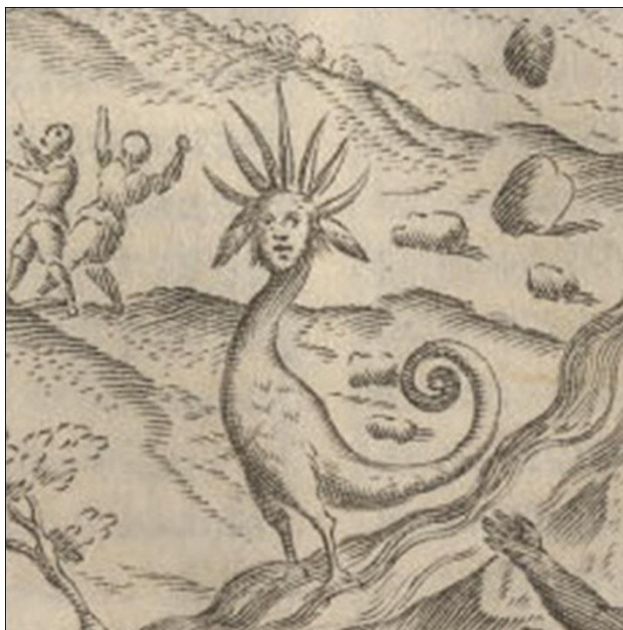
Fig. 13 Detalle del grabado de Hechos milagrosos que procedieron a las paces de Baides en 1641. En el centro aparece representado un monstruo que emerge de la erupción del volcán. Fuente imagen: Histórica Relación del Reyno de Chile , 1646.

En el grabado sobre los hechos milagrosos que procedieron a las paces de Baides en 1641, aparecen dos representaciones cruciales para comprender el sentido de la imagen. Las águilas míticas imperiales, que se pueden observar atacando aldeas indígenas (Fig. 12), las que según Ovalle, sólo habían sido vistas en el paisaje chileno dos veces: durante la primera expedición española a Chile, y en 1640, año de la erupción de aquel volcán y en el que, además, los rebeldes indígenas le rinden homenaje al Dios y al Rey Católico (Prieto, 2010). Por esta razón, existirían otros simbolismos inscritos en este grabado, que representan de algún modo la evangelización, la labor de los jesuitas y su incidencia en el Nuevo Mundo.