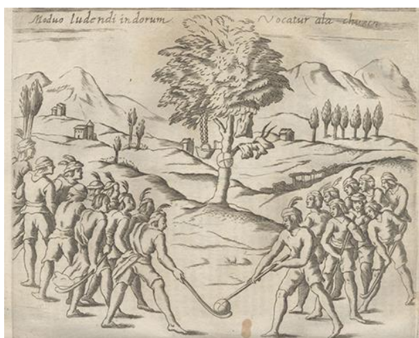
Fig. 4 Grabado. Indígenas jugando la chueca. Fuente imagen: Histórica Relación del Reyno de Chile , 1646.