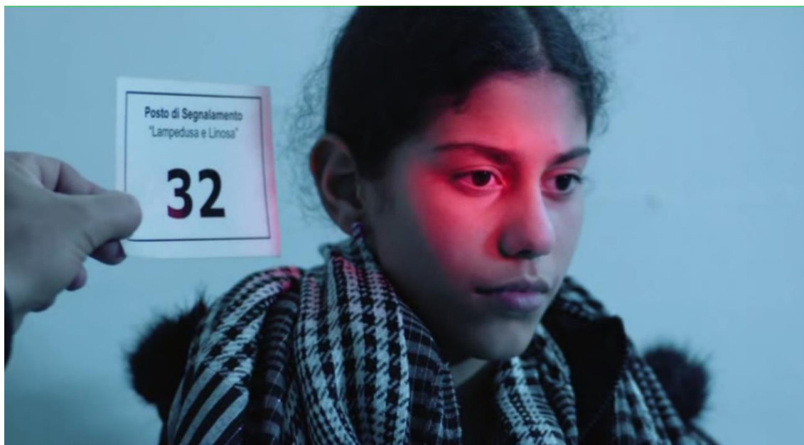
[Fig. 4: Toma de fotografías a los migrantes luego de una operación de rescate, Rosi, 2016a]